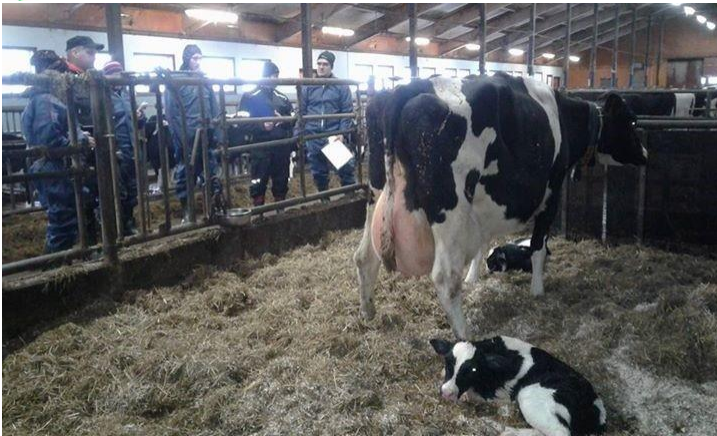
Lean-pienryhmän kokoontuminen Tohmajärvi 14.2.2018.