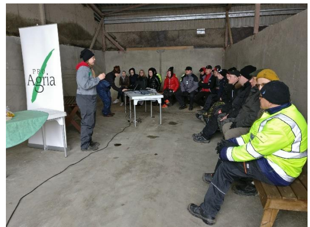
Murskevilja-koulutus 24.4.2018 Liperi