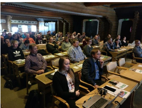
Navettarastit, seminaaripäivä 13.4.2018 Bomba