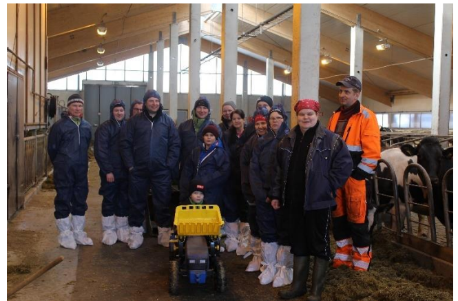
Opintomatka Kainuu-P-Pohjanmaa 4.4.2018 Sotkamo