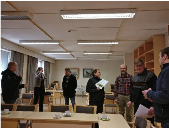
Porukalla parempiin tuloksiin, Nurmes 16.3.2018