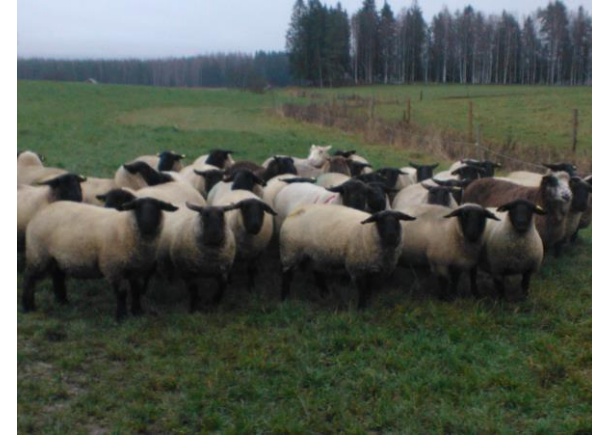
Suffolk, Moisanderin tila