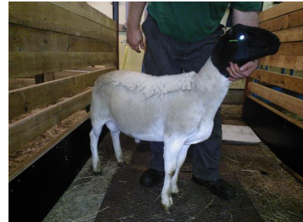
Dorper, Takapajulan tila