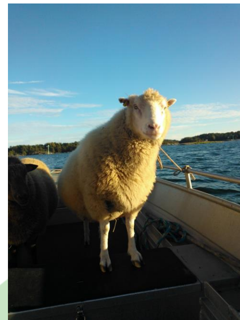
Suomenlammas, Sjöbergin tila