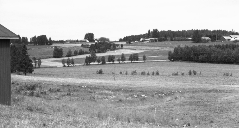
Juvan Kaskii, Etelä-Savon maakuntaliitto 1988