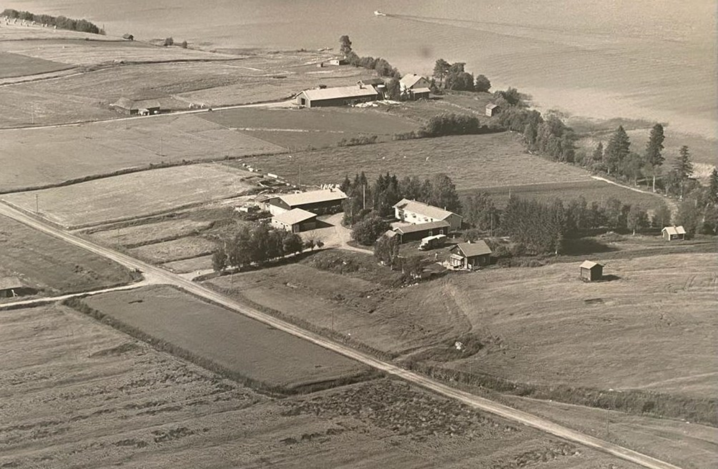
Suomen ilmakuva Oy 1967