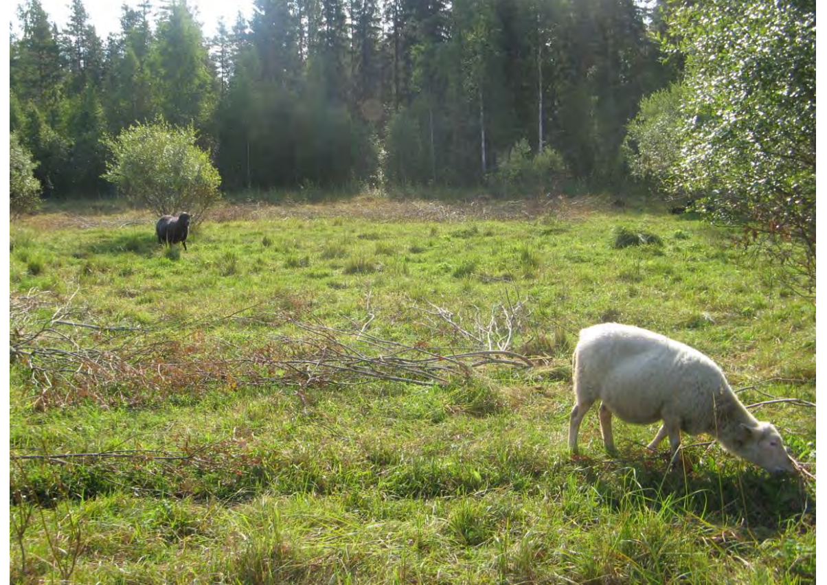
Ympäristösopimukseen hyväksytty myös luonnonlaitumia , jotka voivat syntyä entiselle pellolle