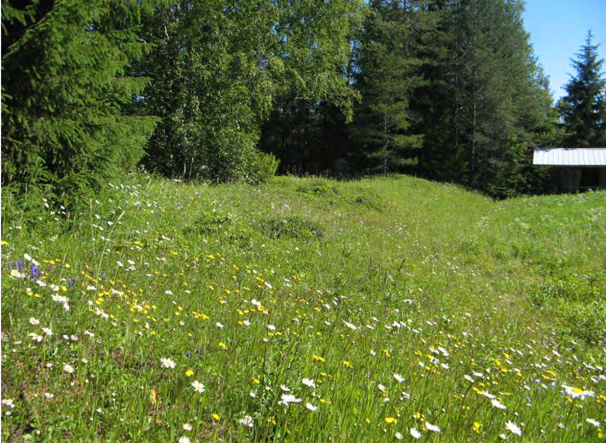
Tuore-kuiva heinäniitty , pitkään niitetty perinnebiotooppi, Kiiminki