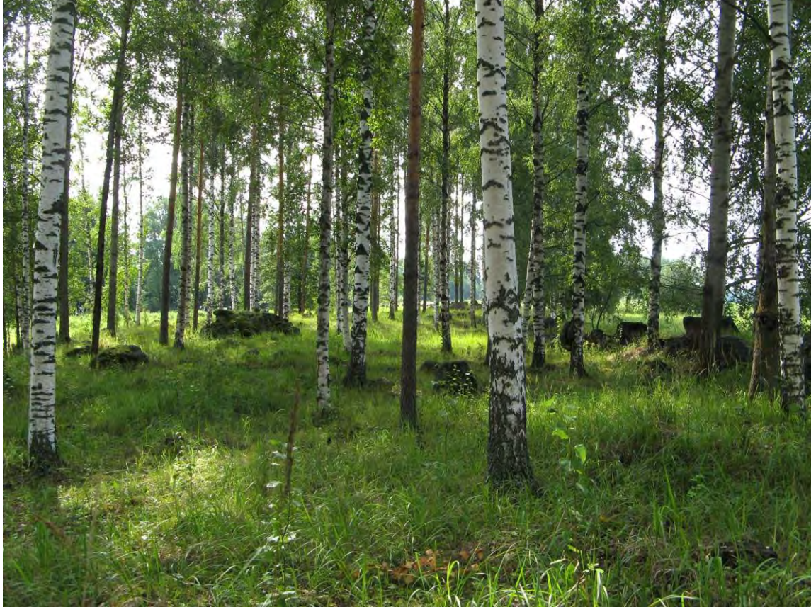
Puustoiset perinnebiotoopit ovat harvapuustoisia hakamaita tai varjoisempia metsälaitumia