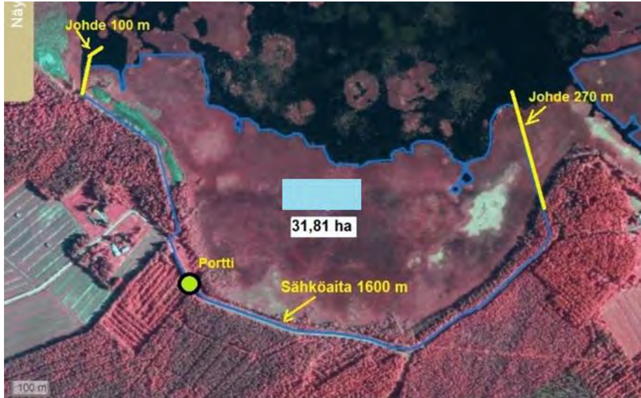
Esimerkki hoitosuunnitelman kartasta, lohkokartta VIPU:sta

VIPU-kartat ovat viljelijän kannalta tärkeitä, koska niiden perusteella maksetaan hoitotuki ja tukia myös valvotaan pinta-alaperusteisesti.