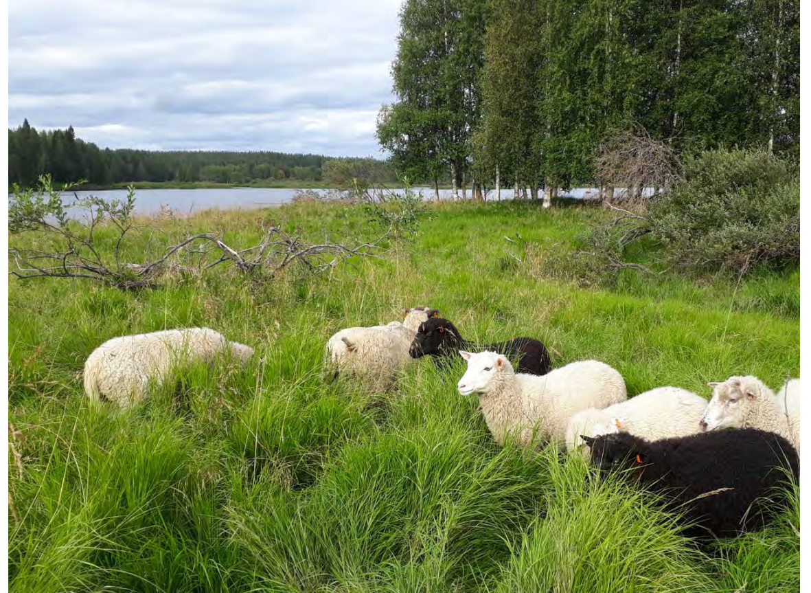
Tulvaniitty lijoella, Jurmu