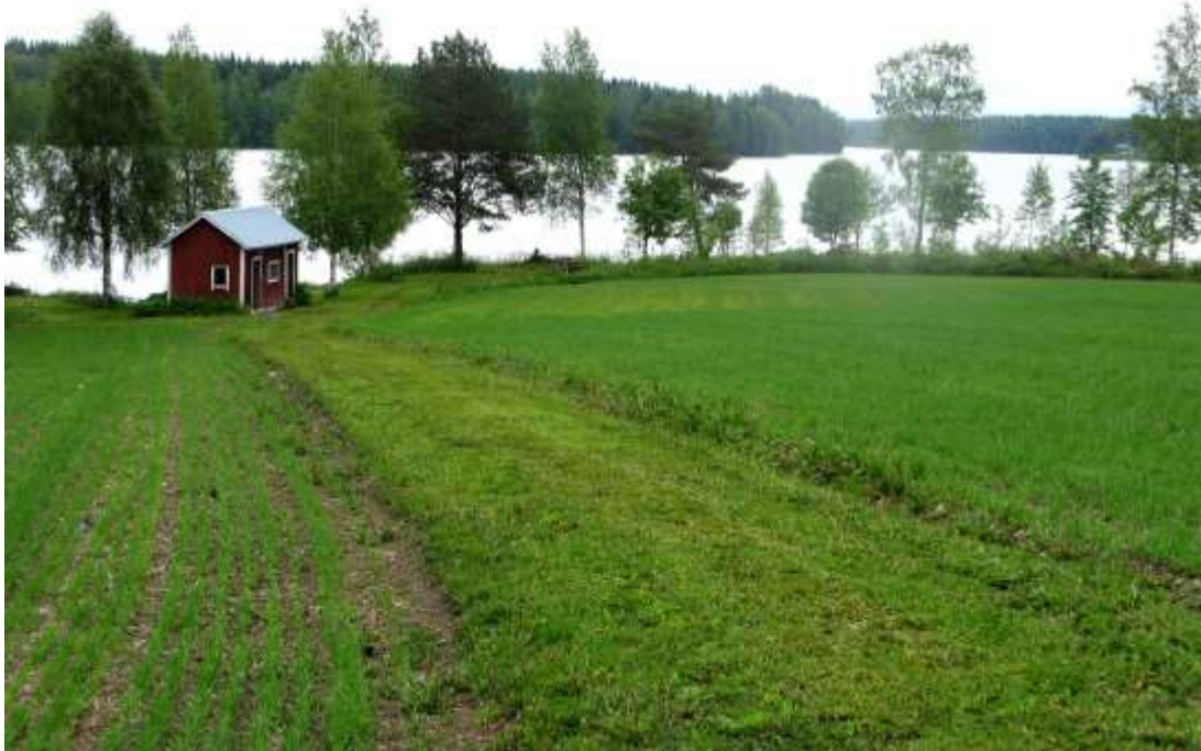
Näkymää järvelle avattu harventamalla rantapuustoa