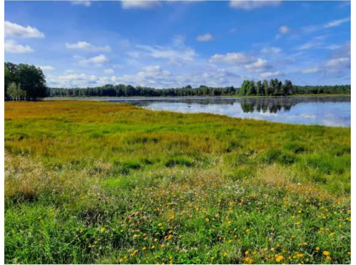
Järvenrantaniitty, hiehojen laiduntama perinnebiotooppi