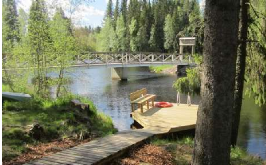
Haapajärvi, Siiponkoski ym.

Mahdollisesti lähdössä mukaan hankkeeseen: