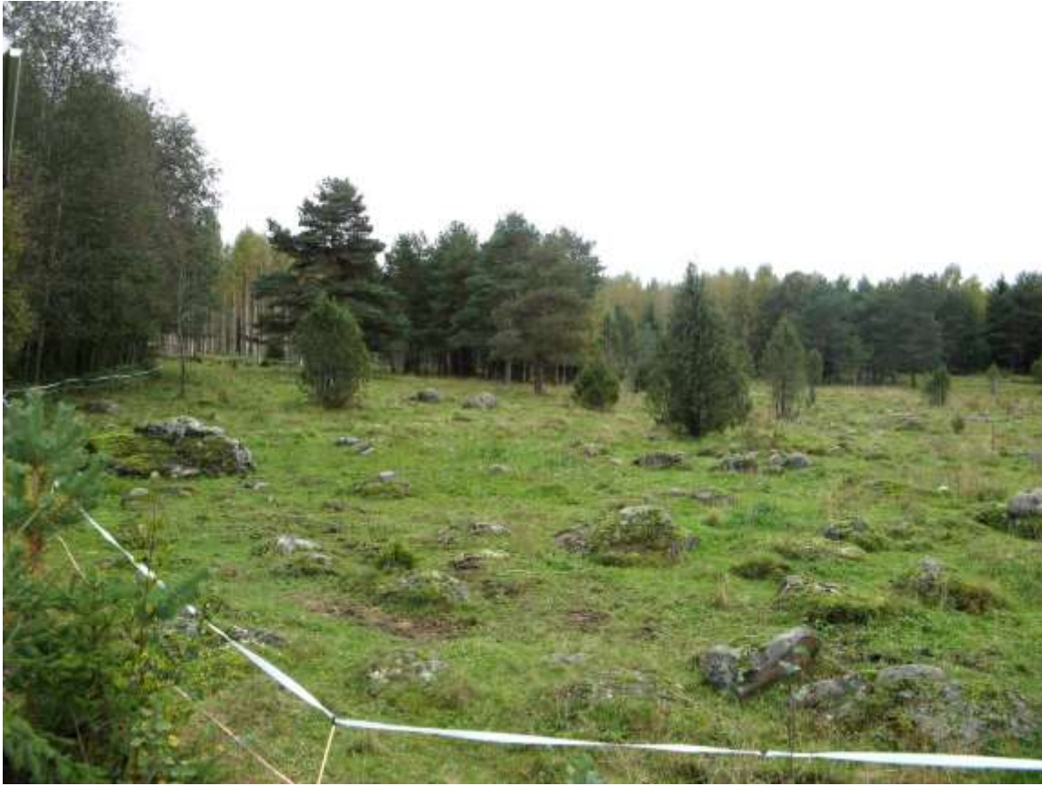
Kivinen tuore niitty, pitkään laidunnettu perinnebiotooppi