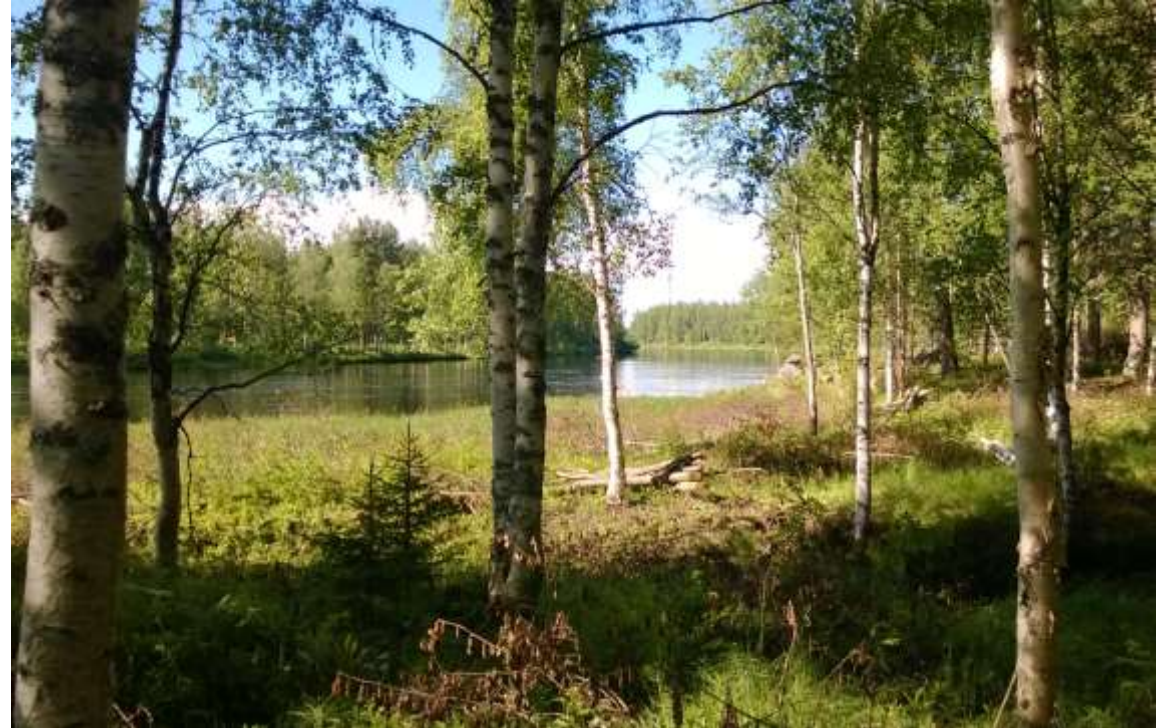
Maisemaraivausta Pudasjärvellä Livojokivarressa