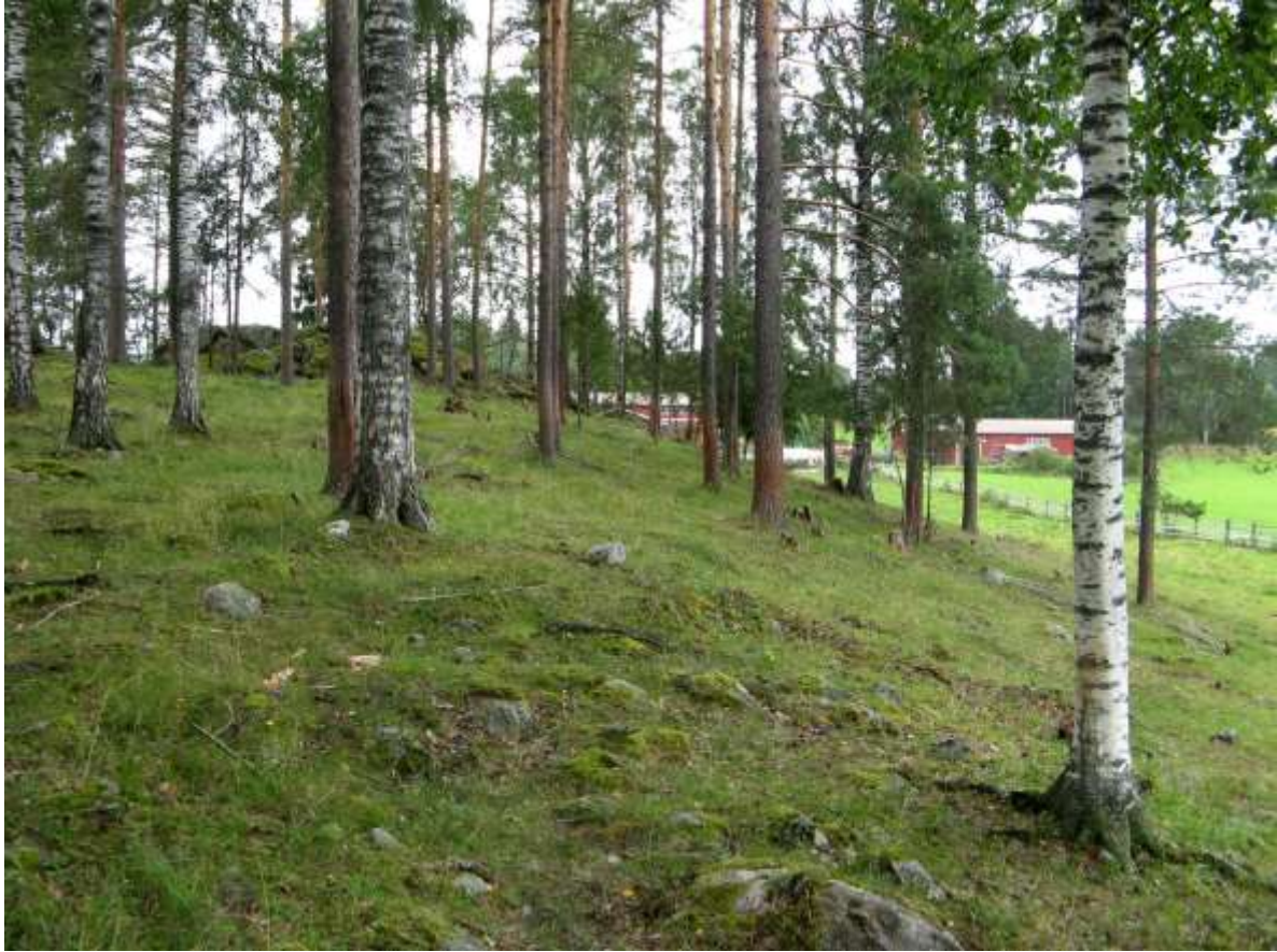
Hyvin laidunnettu metsälaidun