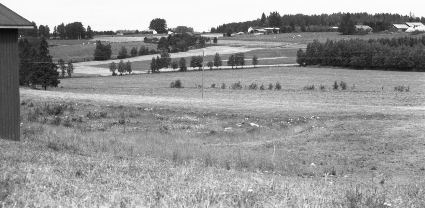
1988, Etelä-Savon maakuntaliitto