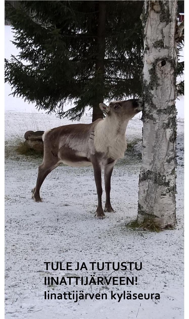
TULE JA TUTUSTU IINATTIJÄRVEEN! Iinattijärven kyläseura