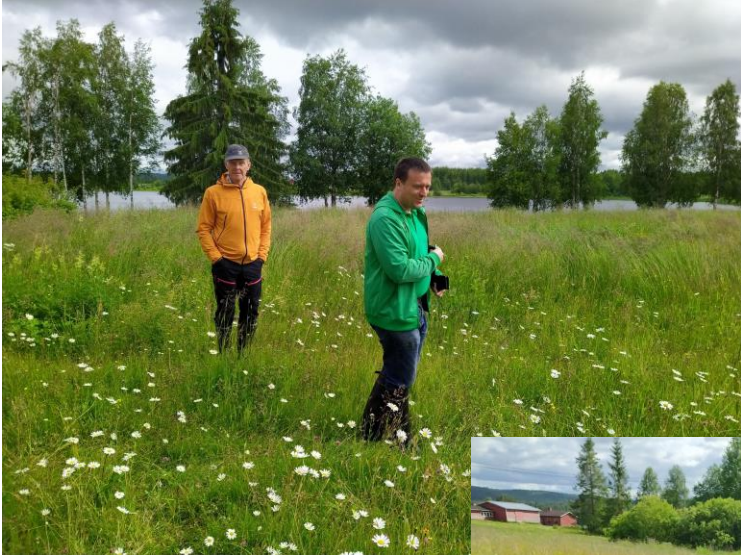
ProAgria Oulu, Oulun Maa- ja kotitalousnaiset