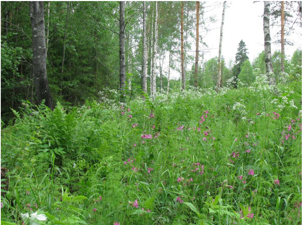
Hoidettua tummaverkkoperhosniittyä Oriveden Siitamassa

Tummaverkkoperhosen suojelemiseksi tarvitaan aktiivisia elinympäristön hoitotoimia. Hoitohankkeen tavoitteena oli saada aikaan laaja hoidettujen tummaverkkoperhosniittyjen verkosto. Niittyjen maanomistajat ovatkin avainasemassa perhosen elinympäristöjen hoidossa. Kohdealueen perhosniityillä oli yli sata maanomistajaa, joiden kanssa kartoitettiin hoitomahdollisuuksia. Neuvotteluiden tuloksena raivattiin n. 37 hehtaaria niittyalueita, yhteensä 41 perhosniittyä. Maisema avartui mm. Tampereen Sorilassa ja Viitapohjassa, Oriveden Siitamassa sekä Kangasalan Mäyrän alueilla. Lisäksi Tampereen kaupunki on teettänyt samassa yhteydessä hoitotoimia omistamallaan perhosniityillä. Pääosin hoidon toteutti ulkopuolinen urakoitsija. Työ on tehty suurimmalta osin konetyönä energiapuukouralla, ja pääosa puuaineksesta hyödynnetään lämpöenergiaksi. Lisäksi yksityisille maanomistajille maksettiin korvauksia omien alueidensa hoidosta.