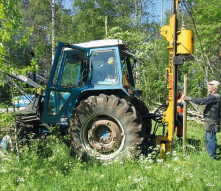
Lammasverkkoaidan aitatolppia pystytetään traktorin ja juntan avulla.