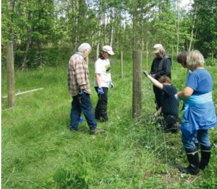
Lammasverkkoa kiinnitetään vasaran ja sinkilöiden avulla aitatolppiin.

Talkoista tiedottaminen hyvissä ajoin on tärkeää. Talko ilmoituksessa on hyvä mainita, jos talkoilaisten pitää itse huolehtia tapaturmavakuutuksesta . Talko ilmoituksessa kannattaa mainita jos talkoolaiset tarvitsevat joitain omia työvälineitä.