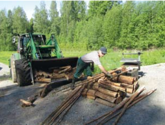
Aitatolppien hiilostaminen nuotiolla.