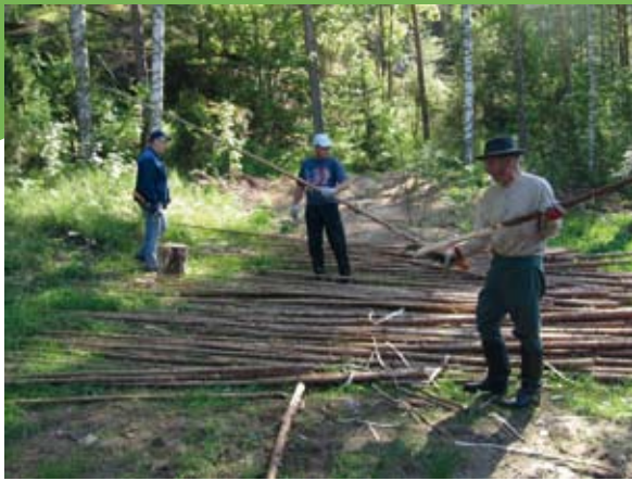
Aitatolppien vuoleminen: kuusiriukuja kuorittiin vesurilla ennen hiilostamista.